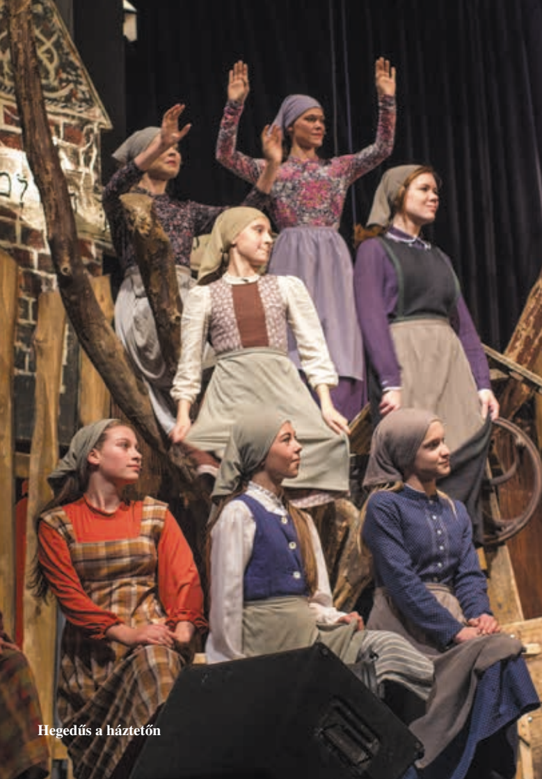
Hegedűs a háztetőn