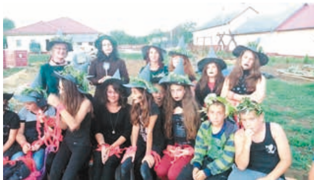
Szafi Tanoda: Szent Iván éj varázslat és néphagyomány

Az őshonos fák kiválasztását a bevont családok végzik el, ők döntenek el, milyen fajtát szeretnének ültetni. A fák ültetéséhez kapcsolódóan szeretnénk hagyományörzés keretében különböző programokat is szervezni (népi étkek napja, lekvár főzés, csigacsinálás, hagyományos oltványozás), melyet szintén a munkacsoportok végeznek el. A gyerekek aktív bevonását is tervezzük – főleg a nyugdíjasok megszólításában (nagyamák és nagypapák tudásának átadását szeretnénk elérni baráti körben). Az apák is fontos szerepet kapnak, terveink szerint az ültetés, metszés, kerti munkák tervezését ők határozzák meg, irányítják az ezzel kapcsolatos teendőket