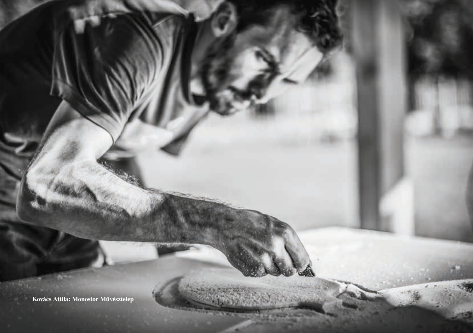
Kovács Attila: Monostor Művésztelep