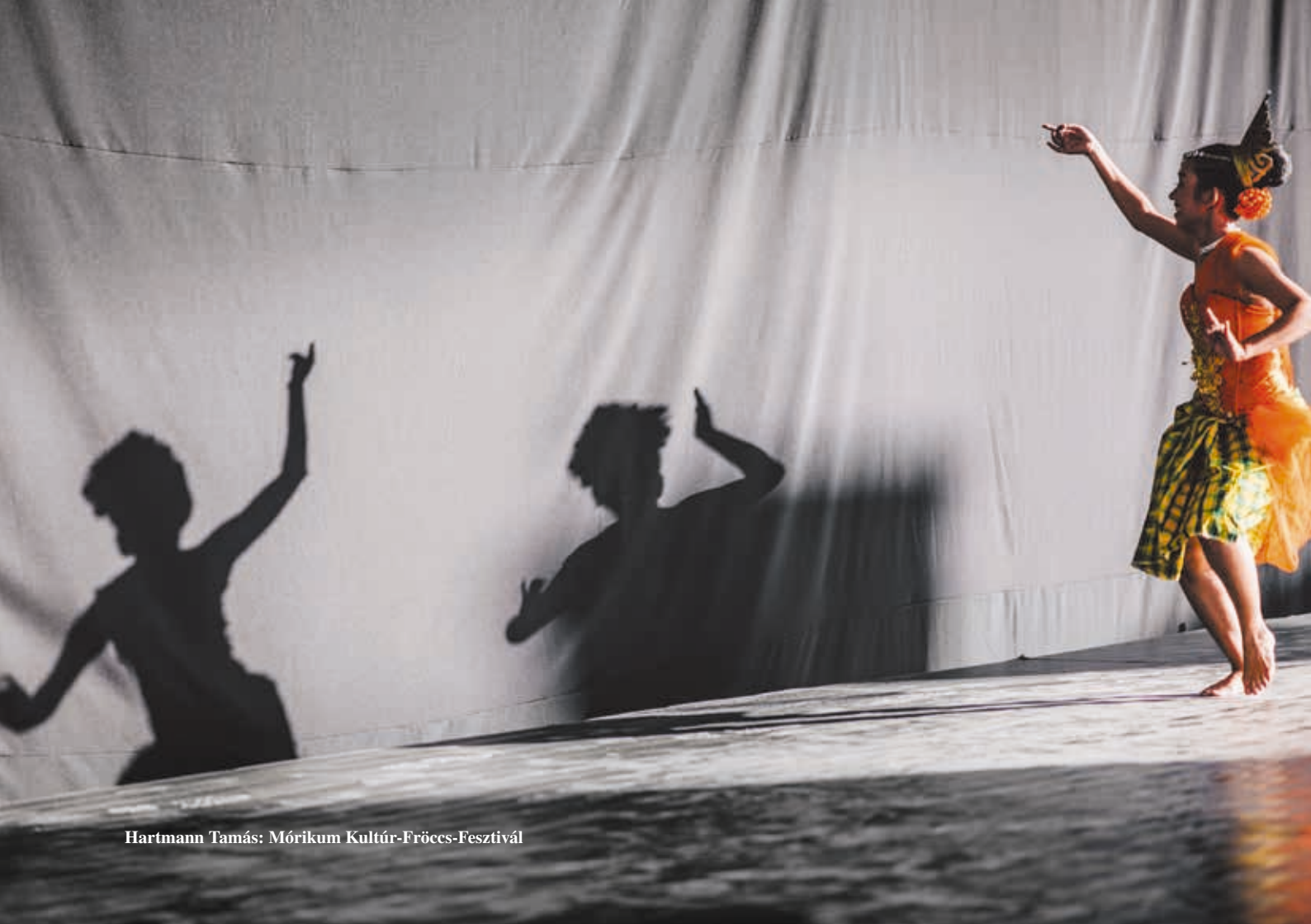
Hartmann Tamás: Mórikum Kultúr-Fröecs-Fesztivál